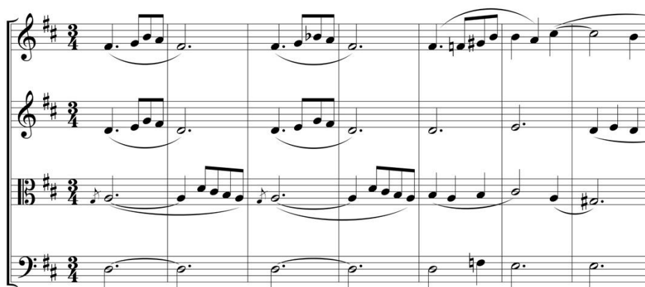
Figura 5. Guerra González, Valses Alemanes (núm. 1) para cuarteto de cuerdas, cc. 1-7, con la trasposición una octava abajo de la parte de la viola

Es mucho más probable que la línea melódica del tercer pentagrama sea para una viola, pero se tendría que leer una octava abajo (figura 5).