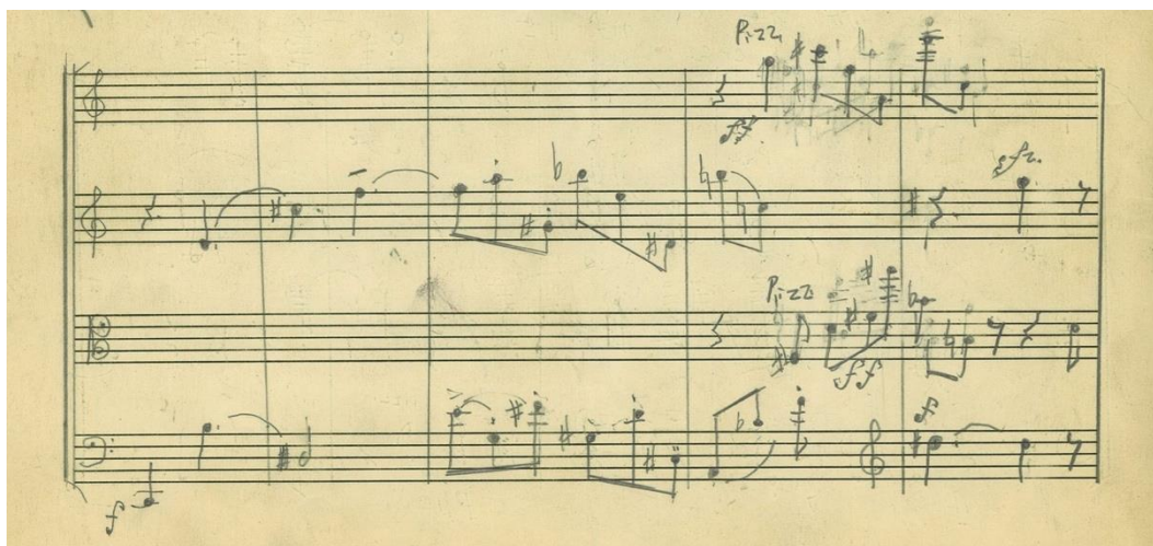
Figura 9. Guerra González, Cuarteto de cuerdas, GVC-7, I mov. ( Allegro ), cc. 23-27 (autógrafo)

En los cc. 23-27 el vl II propone la serie original con mayor claridad: Re, Do#, Fa, La, Sol#, Sib, Mi, Re#, Si, Do, Sol (figura 9). En este caso, muy probablemente, el fa (natural) de la primera nota del c. 25 tendría que ser considerado Fa#: en efecto, no obstante el Fa# aparece como tercera nota en este mismo compás en la parte del vlc, no tendría mucho sentido atribuir 11 notas de la serie a un solo instrumento (el vl II), en lugar de todas las 12 notas.