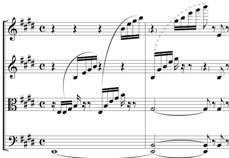
Figura 3. Guerra González, [Cuarteto de cuerdas] en mi mayor (1950), GVc-3, cc. 1-2: versión corregida

Seguramente la asesoría del violinista Antonio Ortíz produjo una indudable mejoría del pasaje en la escritura de una segunda versión del mismo (figura 3).